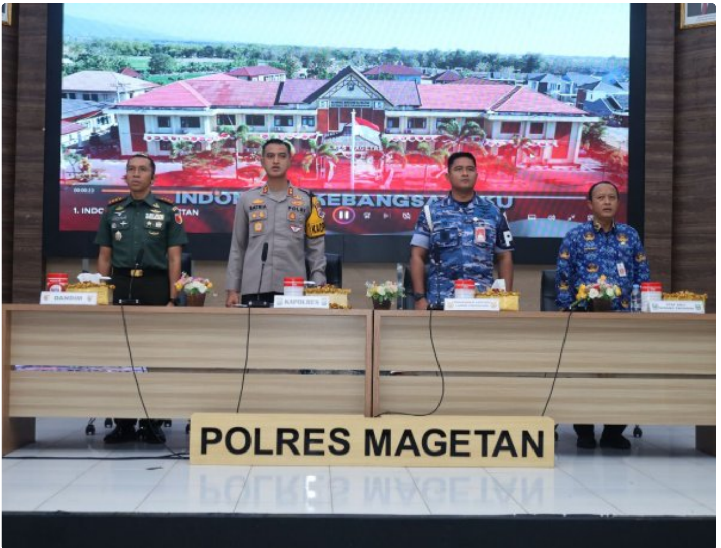
Dandim 0804/Magetan Hadiri Rakor Lintas Sektoral kesiapan operasi lilin 2024

Magetan. – Guna meningkatkan Sinergitas dalam rangka kesiapan operasi lilin